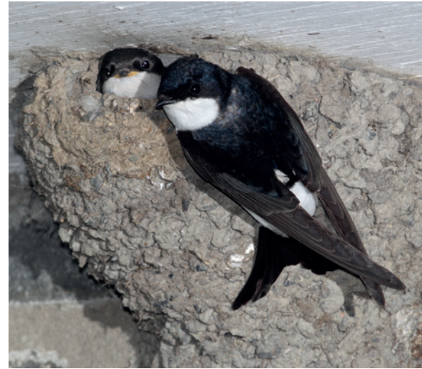
Mehlschnalbe mit Nest.