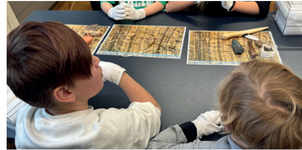
Die Kinder dürfen als ArchäologInnen selber Hand anlegen.

Wir waren im Landesmuseum und haben über alte Zeiten recherchiert. In der Altsteinzeit lebten sie in Zelten aus Ästen und Tierhäuten. Sie sind viel umhergezogen (Nomaden). Muscheln benutzten sie als Gefässe und sie haben daraus auch Schminke