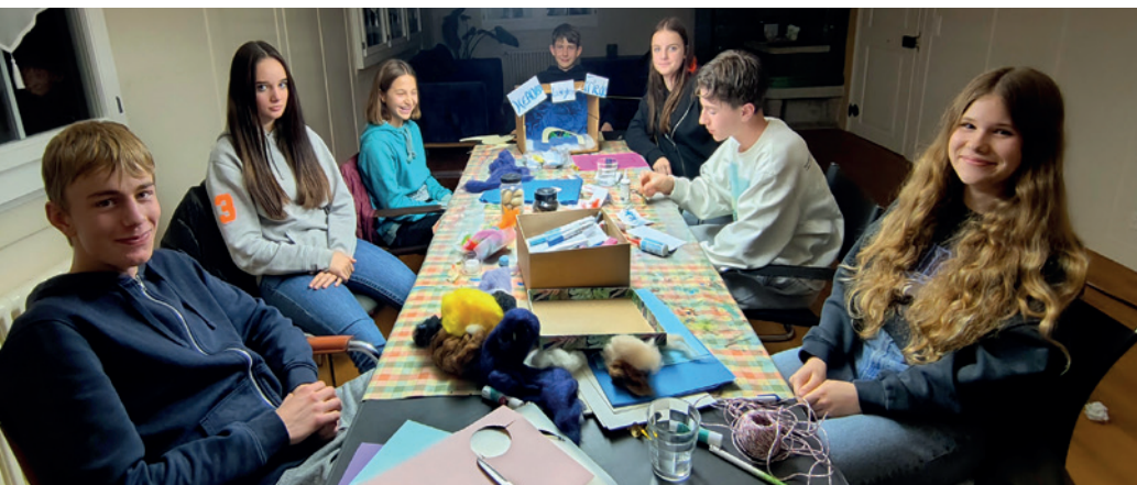
Gut gelaunt die grossen Fragen angehen – die Konfklasse 2025/26!

Sieben Jugendliche werden am 31. Mai in Aeugst konfirmiert. Die Konfirmation markiert den Übergang zum Erwachsenwerden, ein Schwellenmoment, in dem sie zurück und nach vorne blicken.