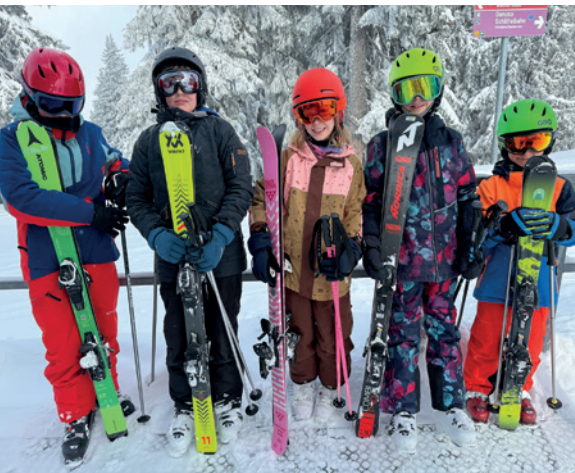
Im Team macht es doppelt so viel Spass!