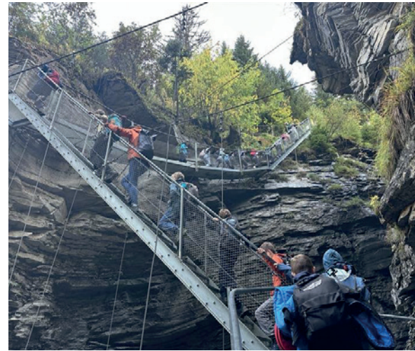
Spannender Weg durch die Schucht