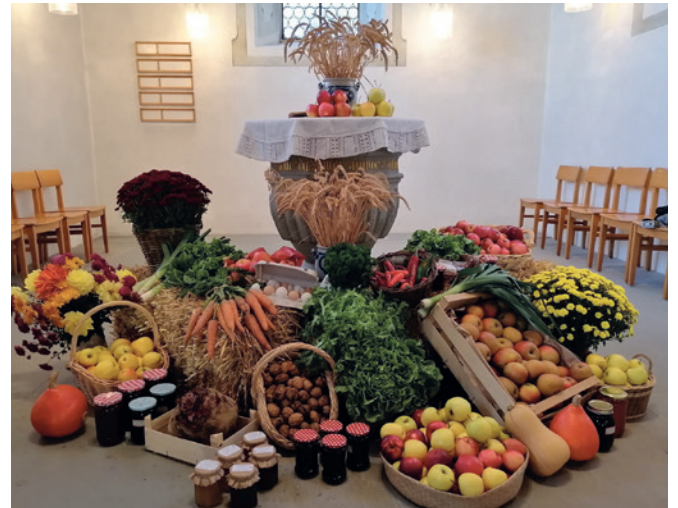
Reicher Ackersegen und hausfrauliche Wertarbeit, gespendet von den Aeugster Landfrauen zum Erntedank-Gottesdienst 2022