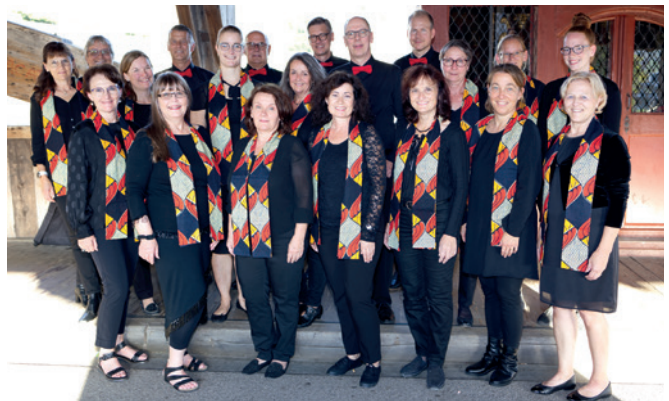
Die Happy Voices freuen sich auf Ihren Konzertbesuch