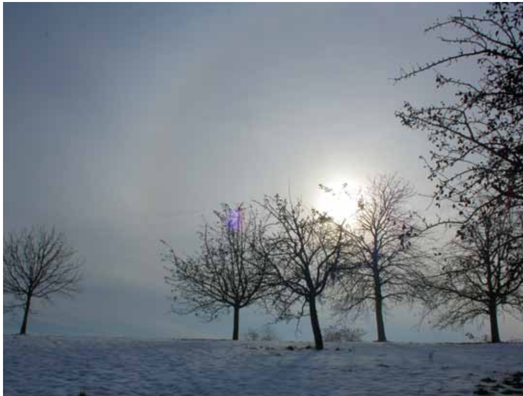
Der erste Schnee ist schon von gestern – er kam im Oktober

Elternverein, Kirch- und Schulgemeinde und vor allem viele Helferinnen und Helfer gestalten die Aeugster Adventszeit.