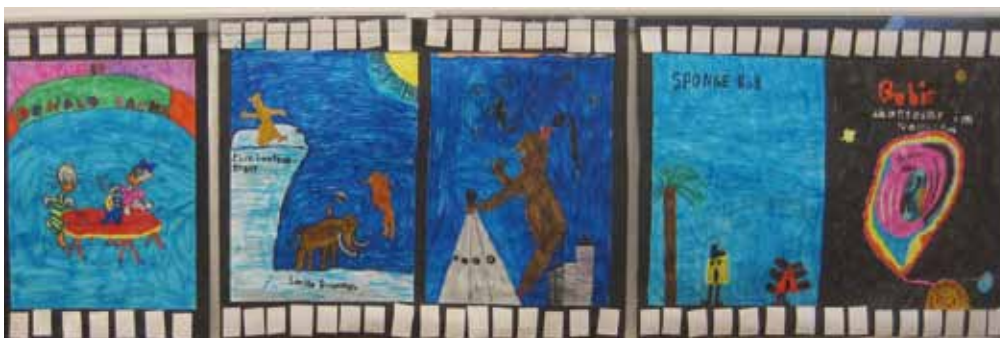
Die Filmplakate wurden in altersdurchmischten Gruppen gestaltet.